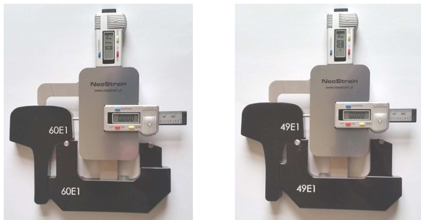
Rys. 2. Zerowanie linaiałów profilomierza na wzorcu szyn 60E1 oraz 49E1

W celu dokonania pomiaru zużycia główki szyny w wybranym przekroju należy do korpusu przyrządu założyć odpowiadający danemu typowi szyny segment pomiarowy (2), a następnie włączyć linaiały (przycisk czerwony) i przyłożyć przyrząd do wzorca główki szyny 60E1 lub 49E1 (wchodzącego w skład zestawu pomiarowego) w sposób pokazany na rysunku 2. Przyciskami (przycisk żółty) wyzerować odczyty linaiałów pomiarowych.